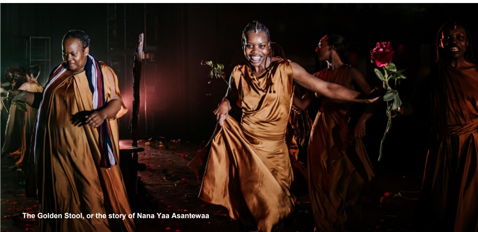
The Golden Stool, or the story of Nana Yaa Asantewaa