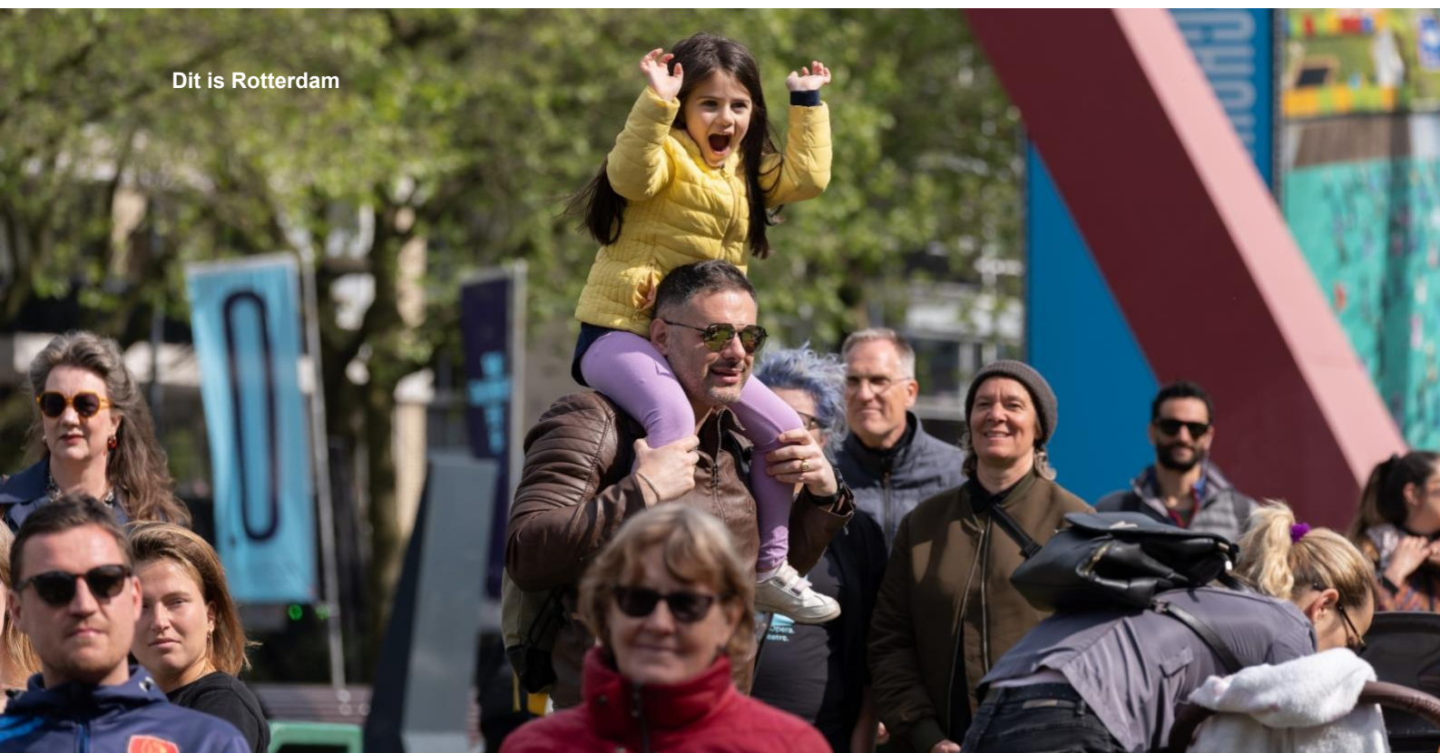
Dit is Rotterdam

Het stadsfeest werd enthousiast ontvangen door het publiek dat, mede vanwege het mooie weer, massaal bleef staan voor de optredens. In totaal bezochten 4.500 mensen een deel van het programma.