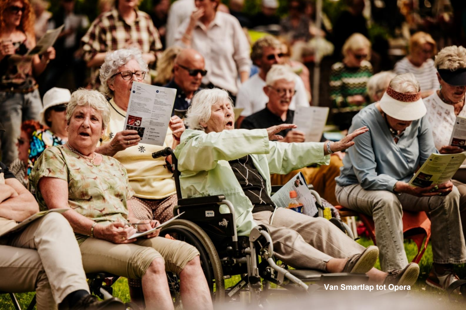
Van Smartlap tot Opera