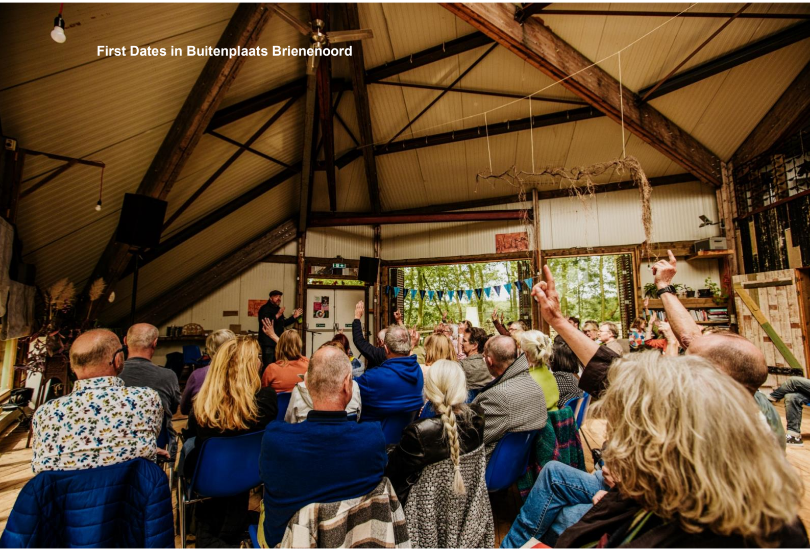
First Dates in Buitenplaats Brieneoord

O. zet steeds meer in op kleinere locatiepartners en vindt daar gelukkig veel positieve respons.