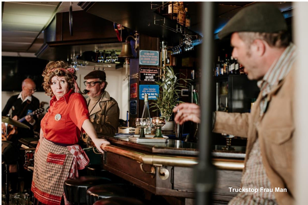
Truckstop Frau Man

Naast deze twee voorbeelden waren er deze festivaleditie ook projecten op unieke locaties als BRUTUS, Room Mate Hotel, een bejaardencentrum in Rotterdam Noord en op legio buitenpleinen.